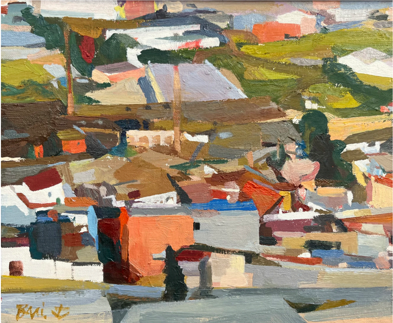
Onda ● Huile sur toile 22 x 27 cm