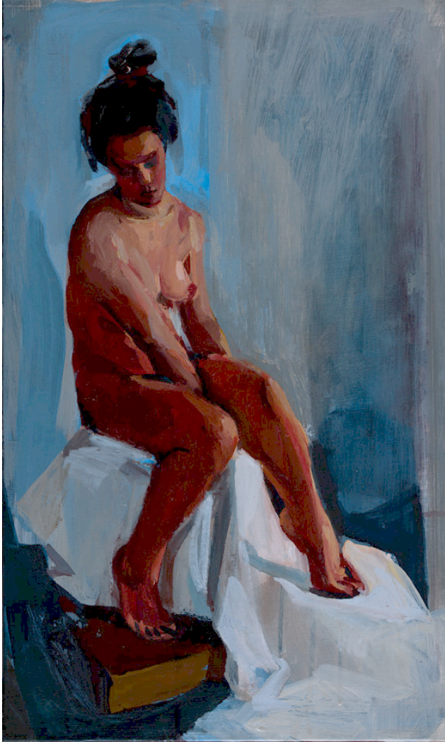
Sara ● Huile sur papier 2017 50 x 30 cm