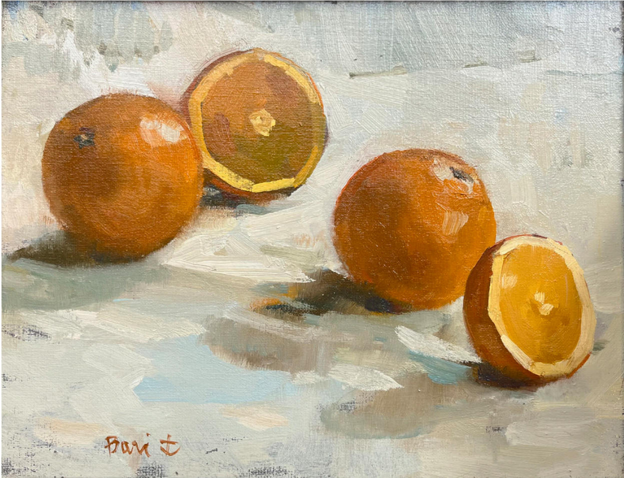
Les oranges Huile sur toile 27 x 35 cm