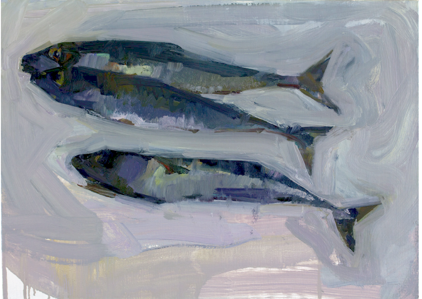
On nage ● Huile sur toile 2014 33 x 46 cm