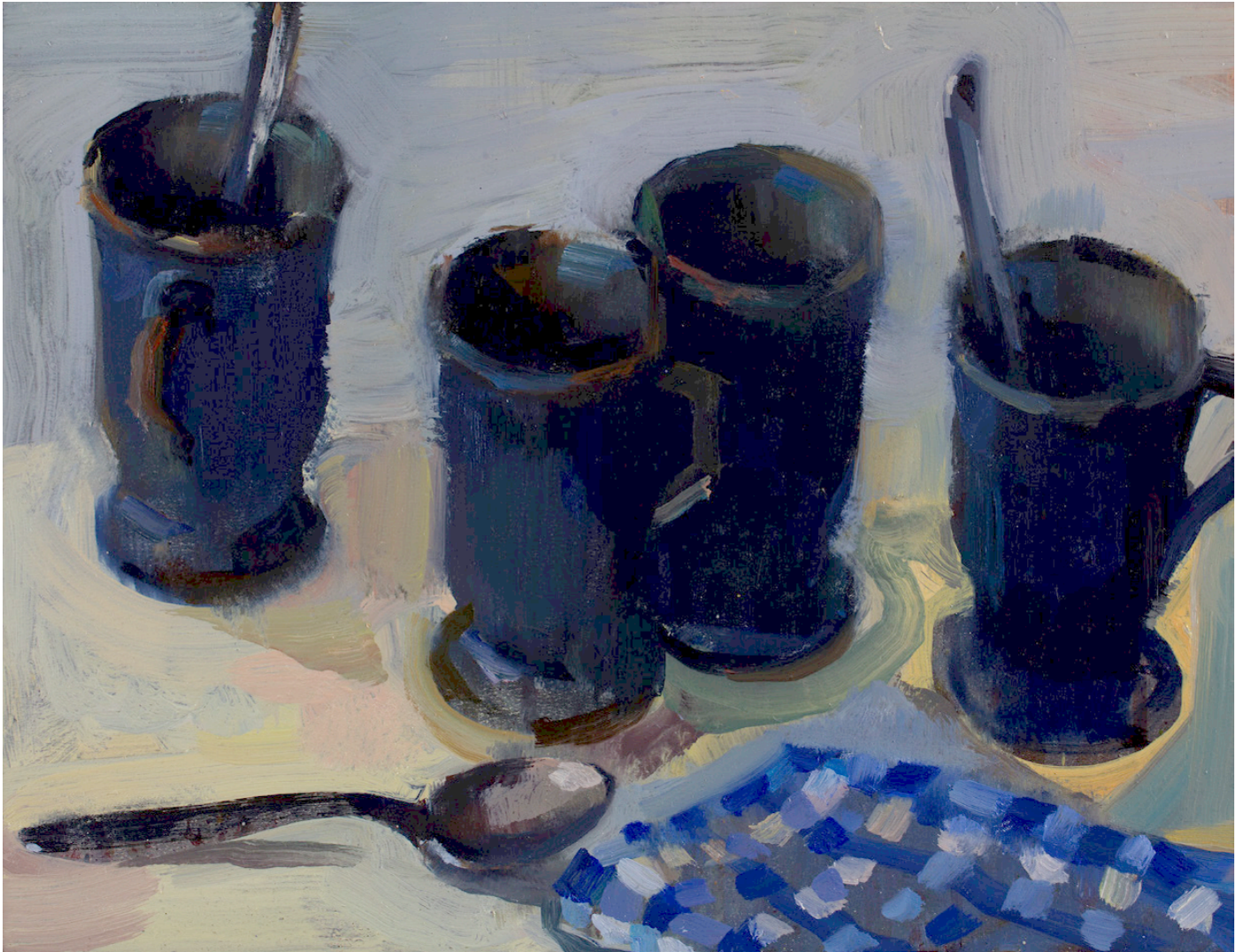
Quatre cafés Huile sur bois 2014 27 x 35 cm