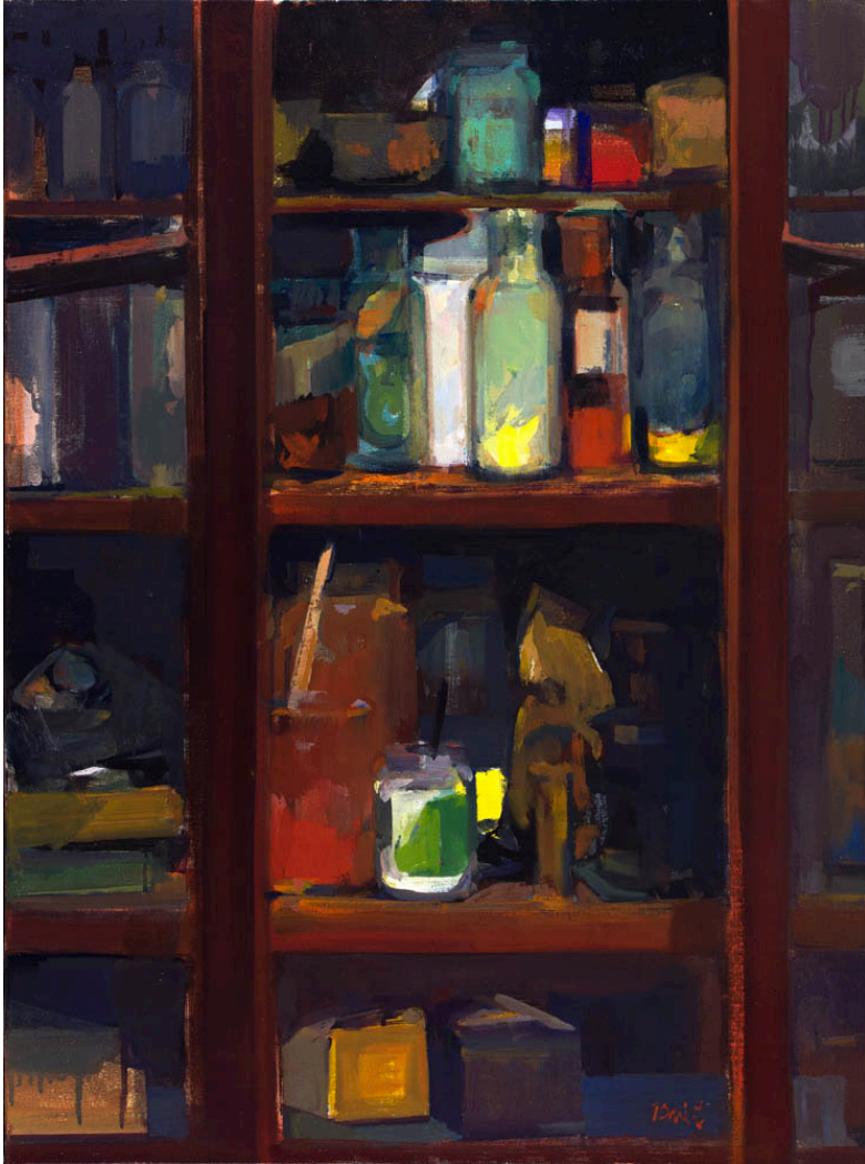
L'armoire Huile sur toile 2014 81 x 60 cm