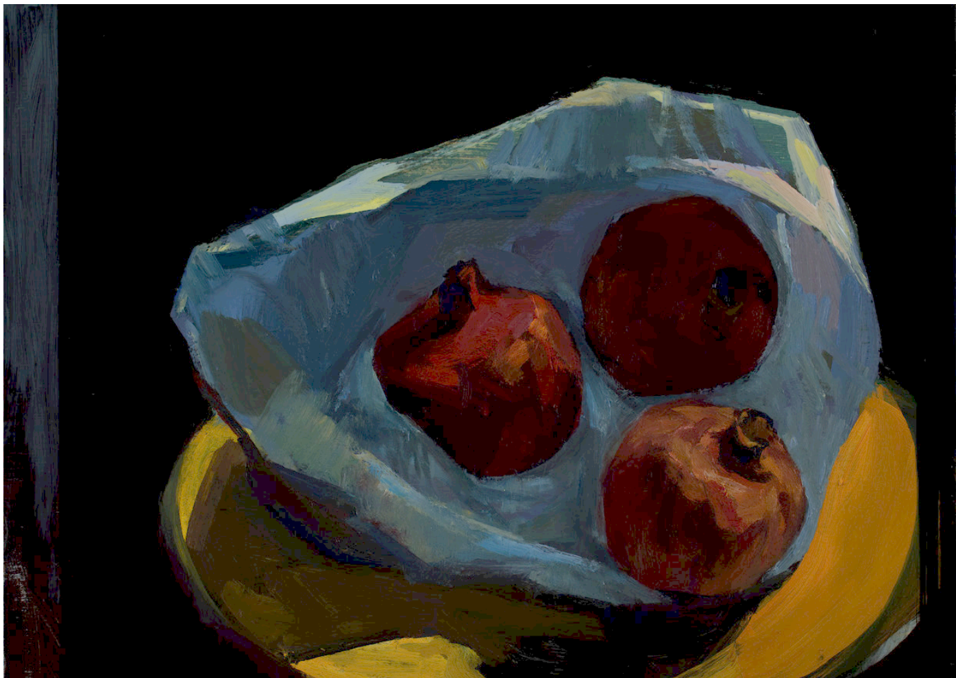
Trois grenades ● Huile sur bois 2017 33 x 46 cm