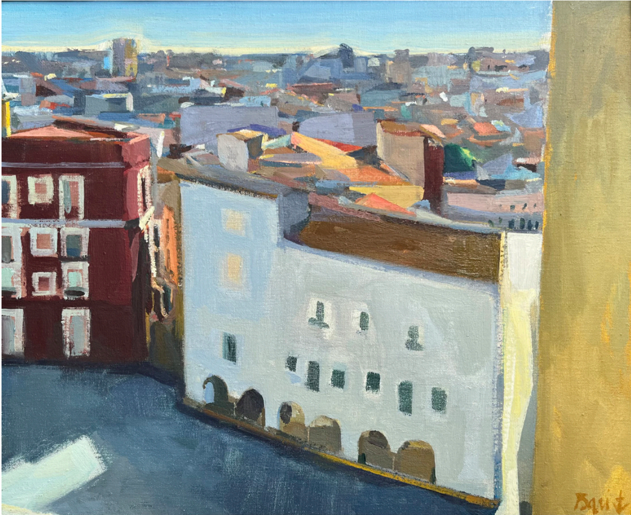
Badajoz ● Huile sur toile 2008 46 x 38 cm