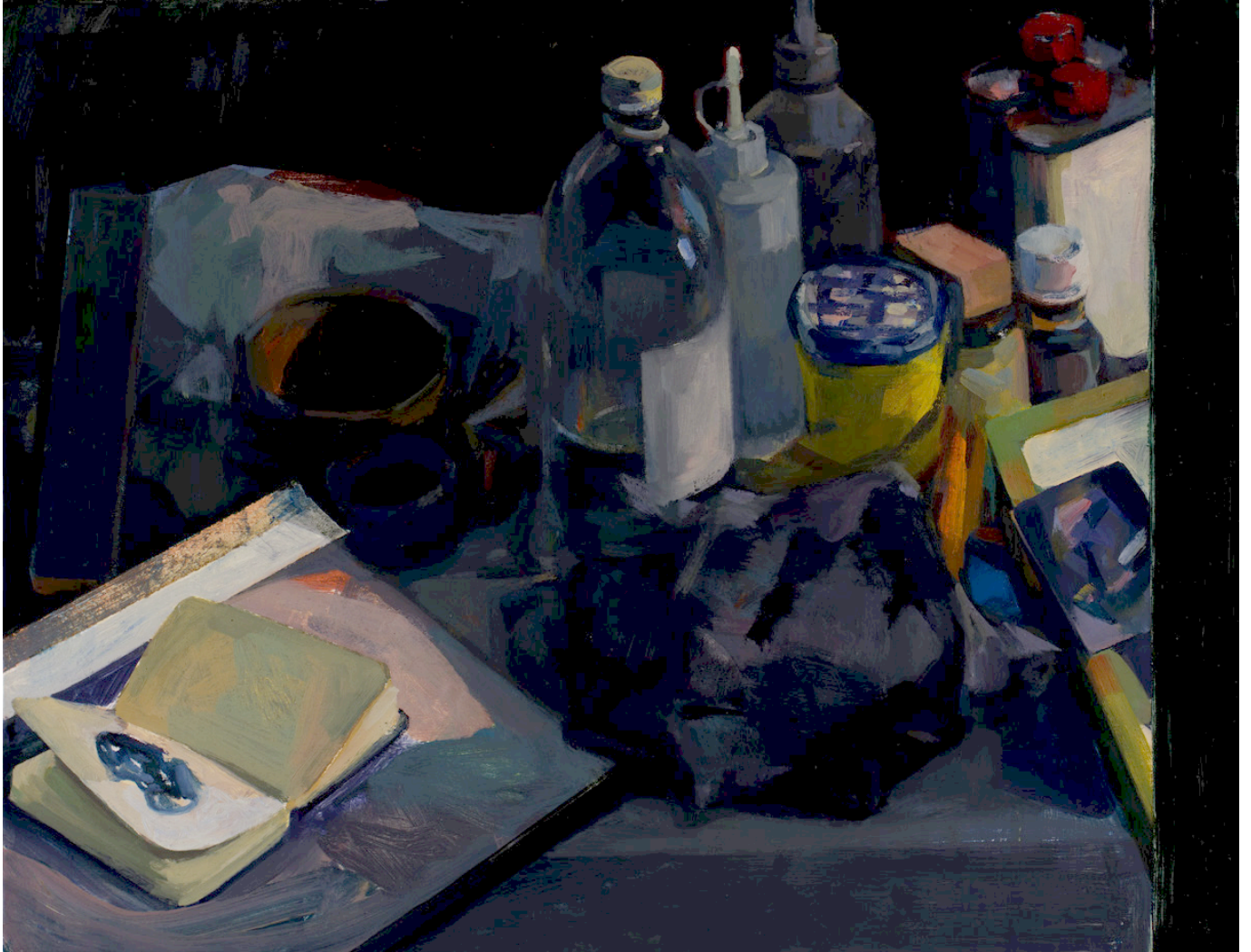
Le carnet Huile sur papier 2016 50 x 65 cm