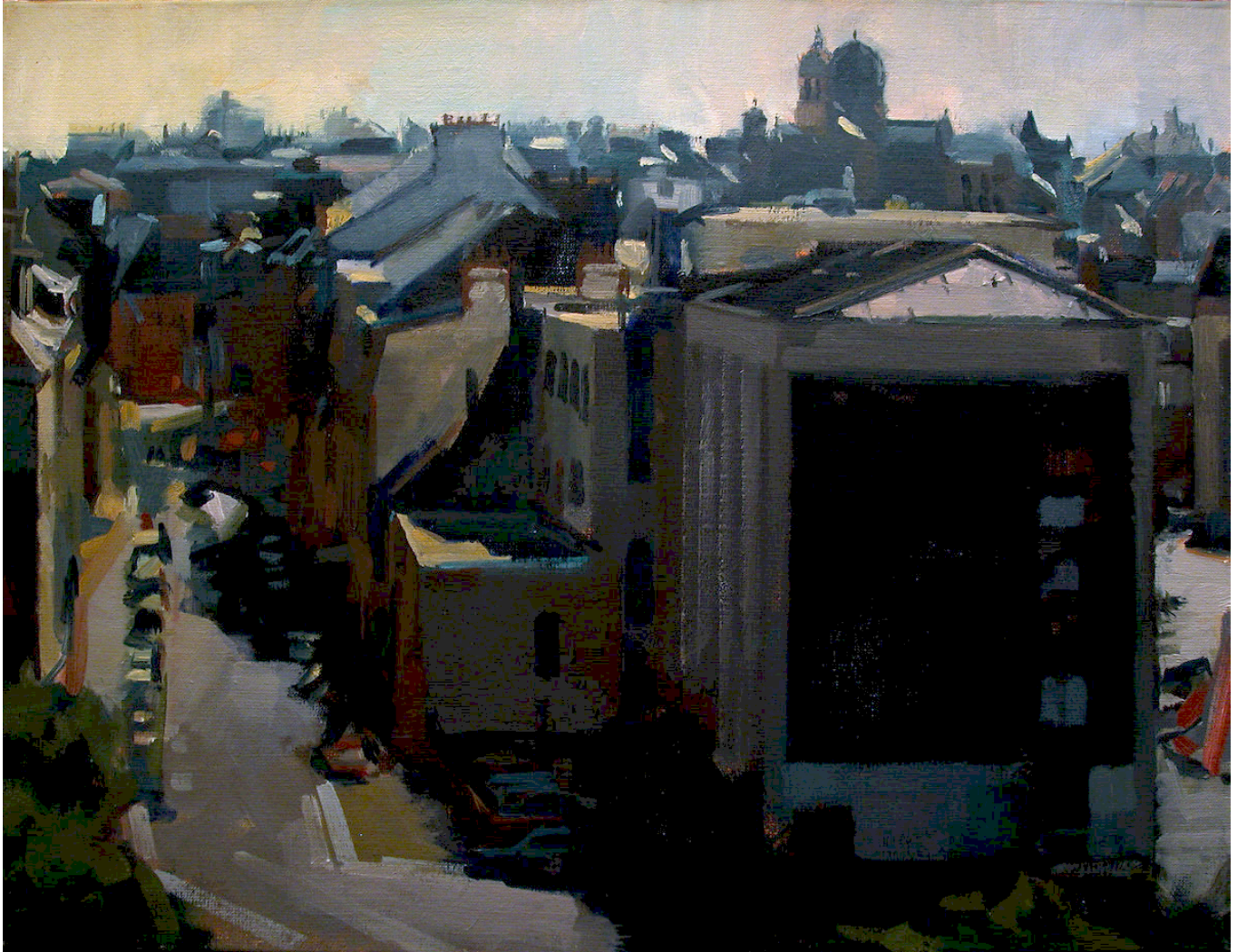
Granville Huile sur toile 2003 65 x 50 cm