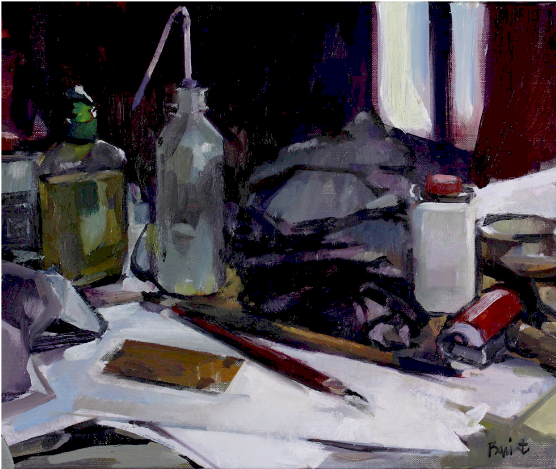
La gravure Huile sur toile 2011 38 x 46 cm