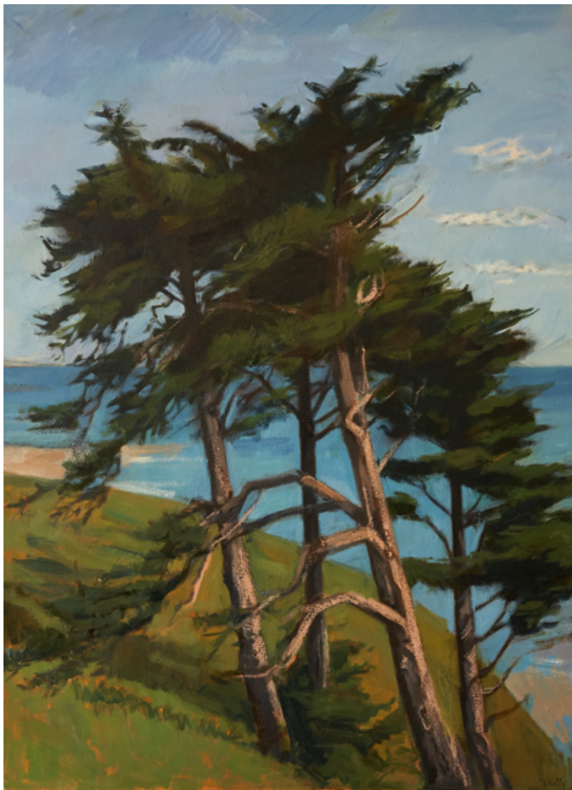
Les pins Huile sur toile 130 x 97 cm