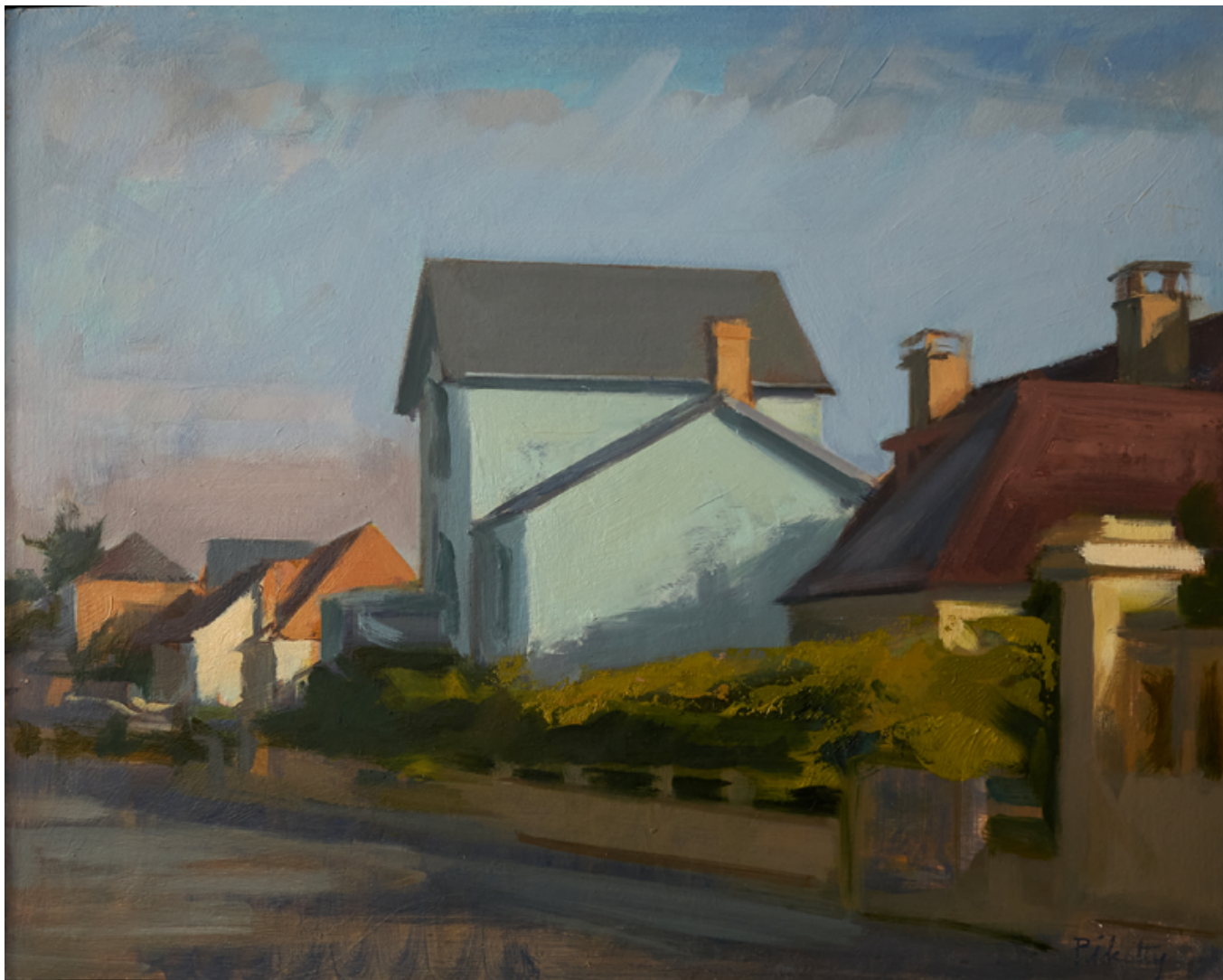
La villa bleue Huile sur bois 30 x 41 cm