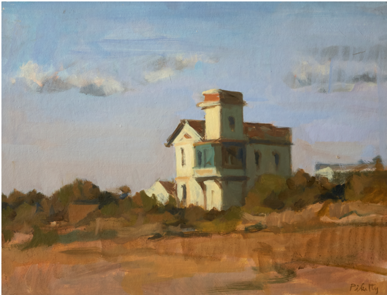
La villa à la tour Huile sur bois 30 x 40 cm