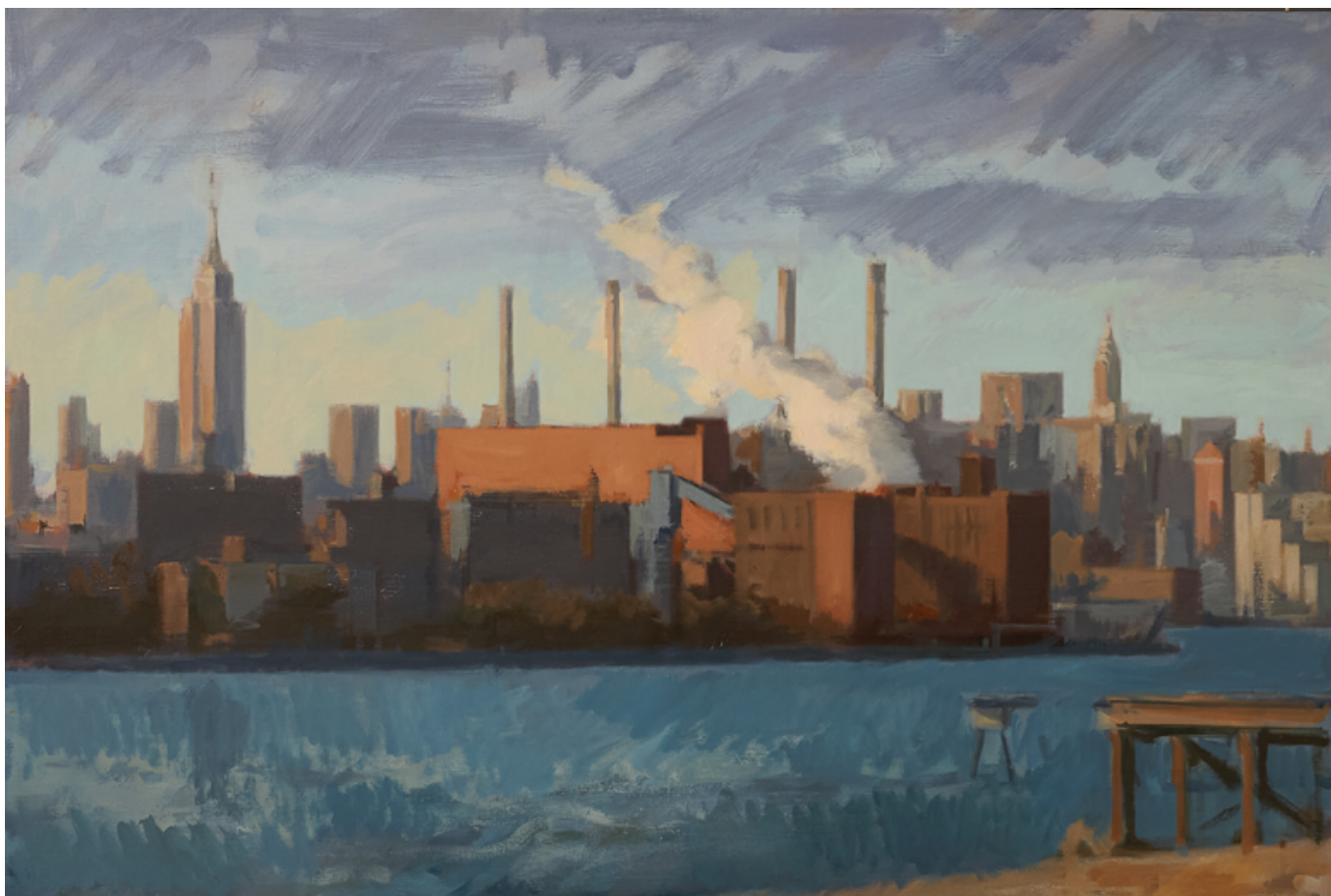
New York Huile sur toile 80 x 120 cm