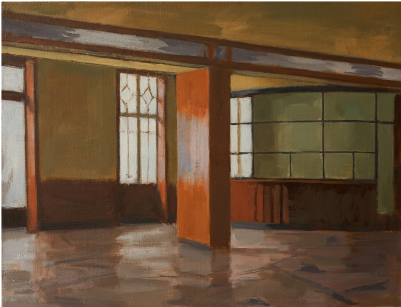
Way Out - Gare maritime de Cherbourg