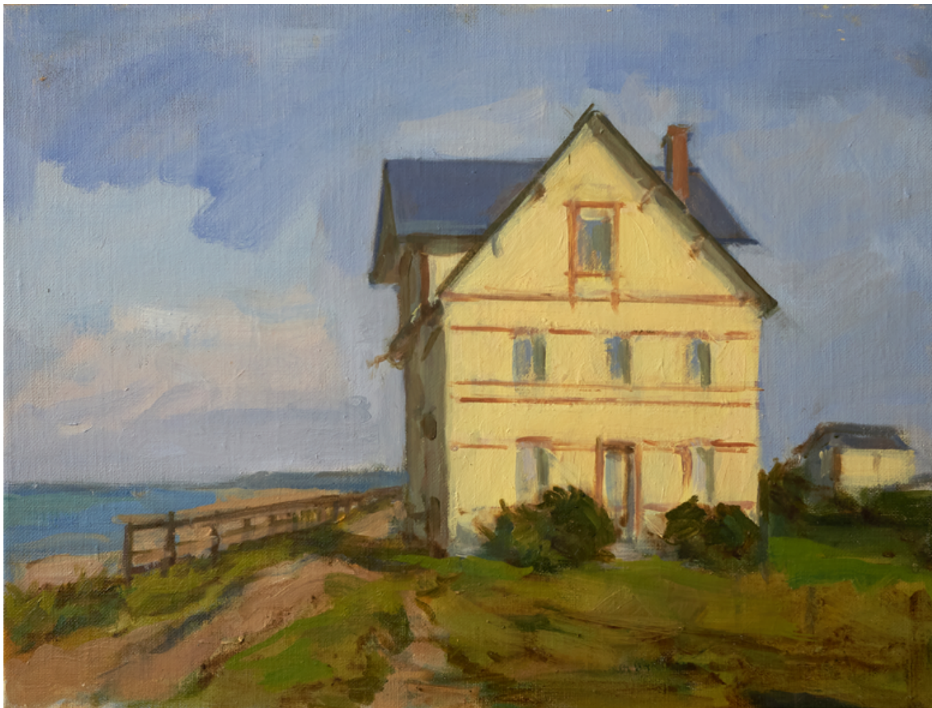
La villa - Portbail Huile sur bois 30 x 40 cm