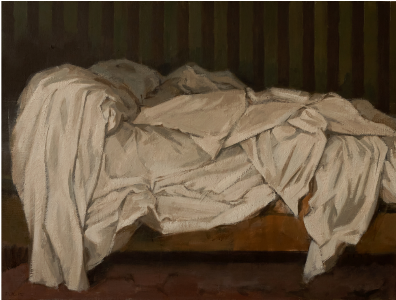
Le lit Huile sur toile 60 x 81 cm