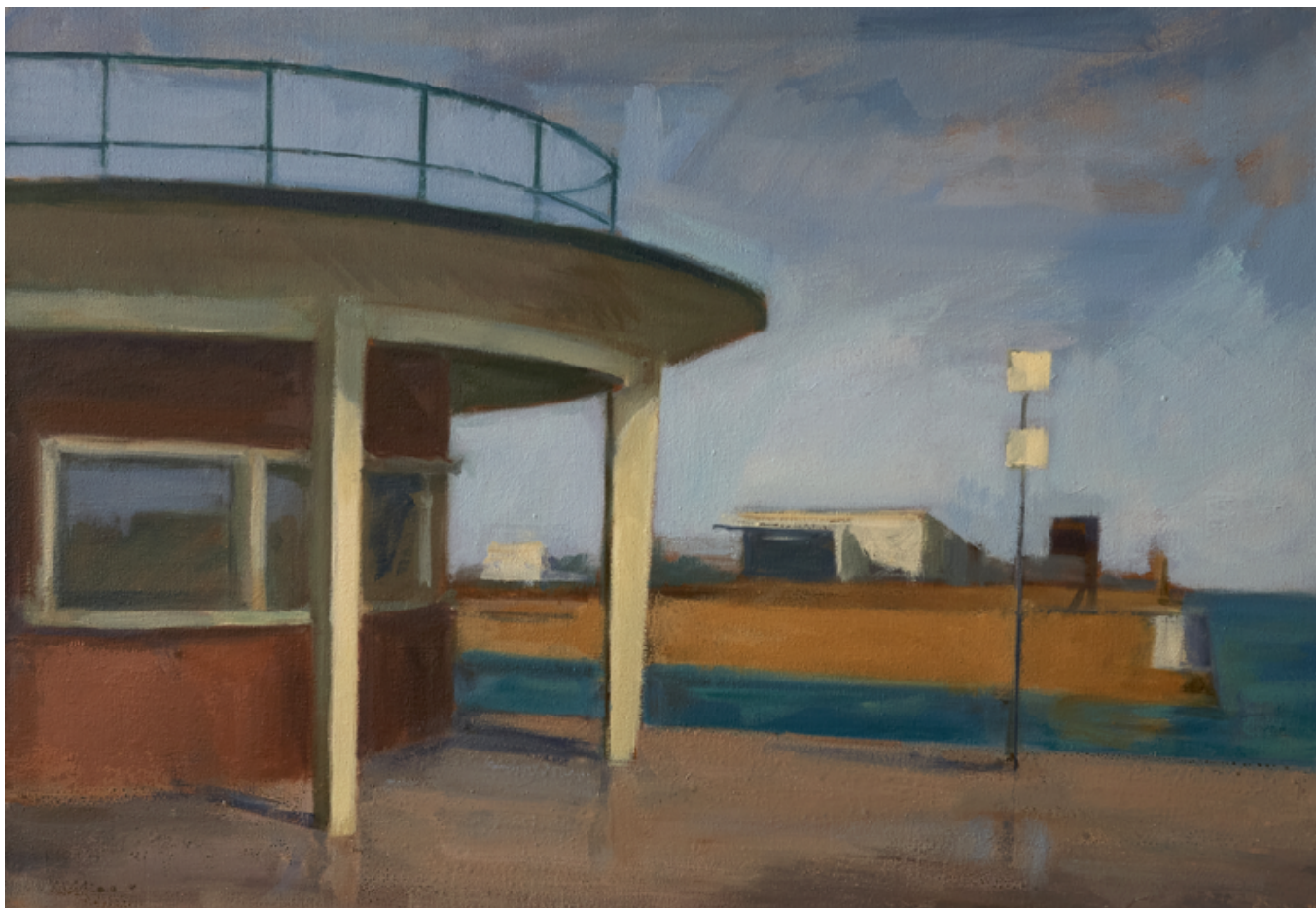
Criée de l'Épi - Cherbourg Huile sur toile 38 x 55 cm