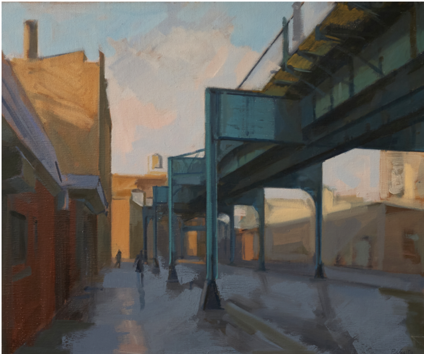
New York - Métro Huile sur toile 60 x 73 cm