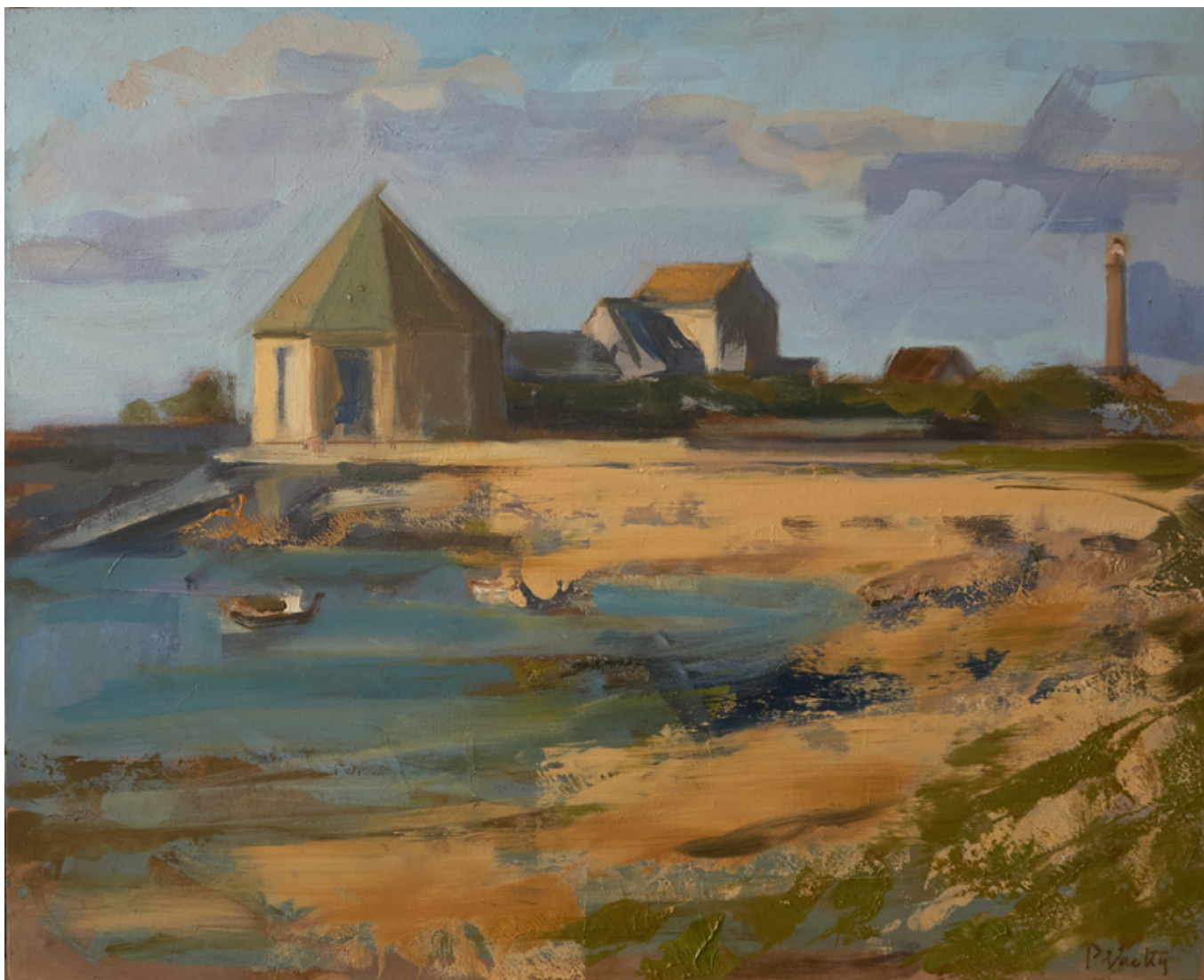
Le port de Goury Huile sur bois 33 x 41 cm