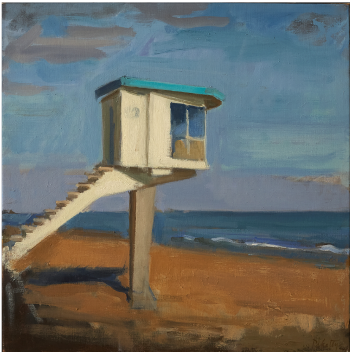
La vigie - Lion-sur-Mer