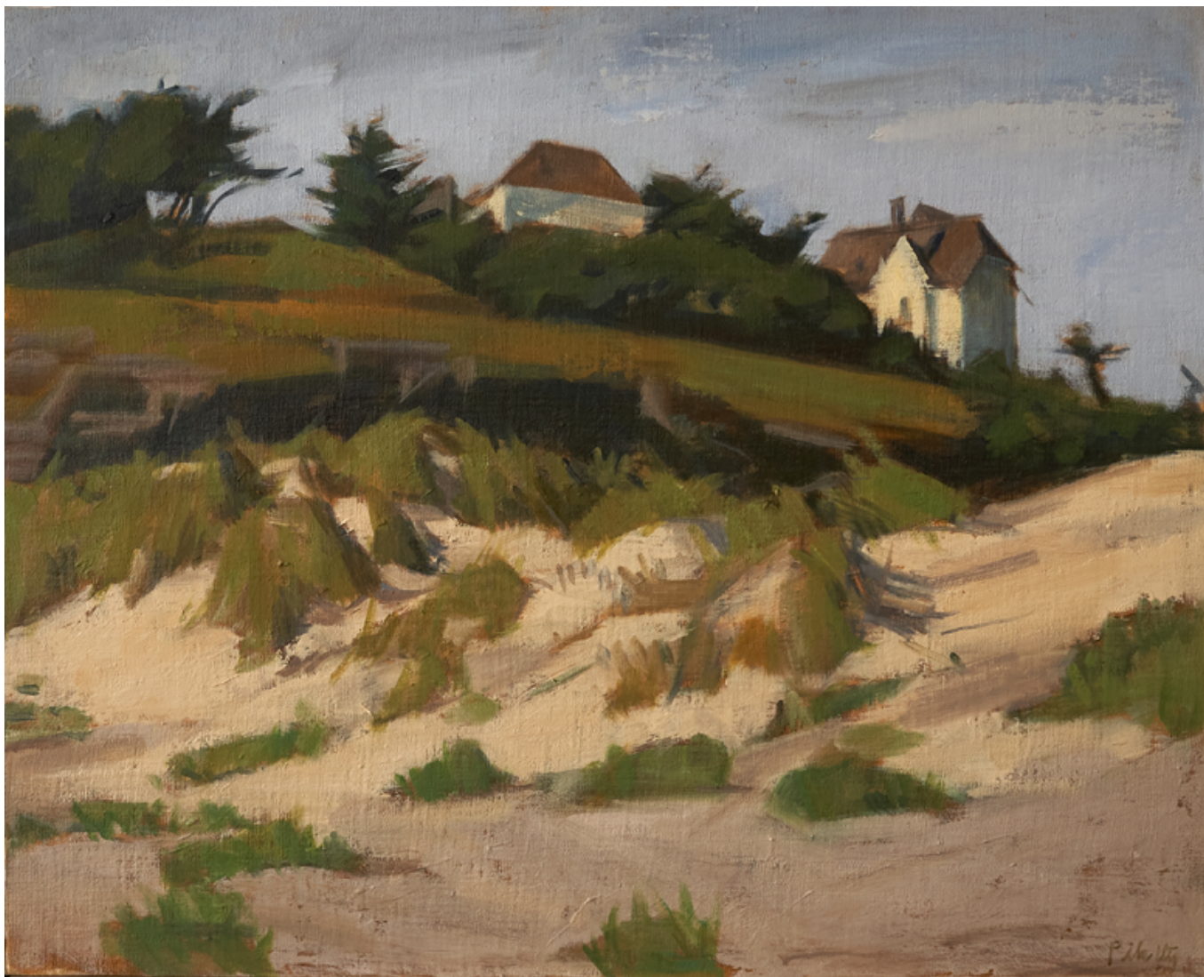
La dune Huile sur bois 40 x 50 cm