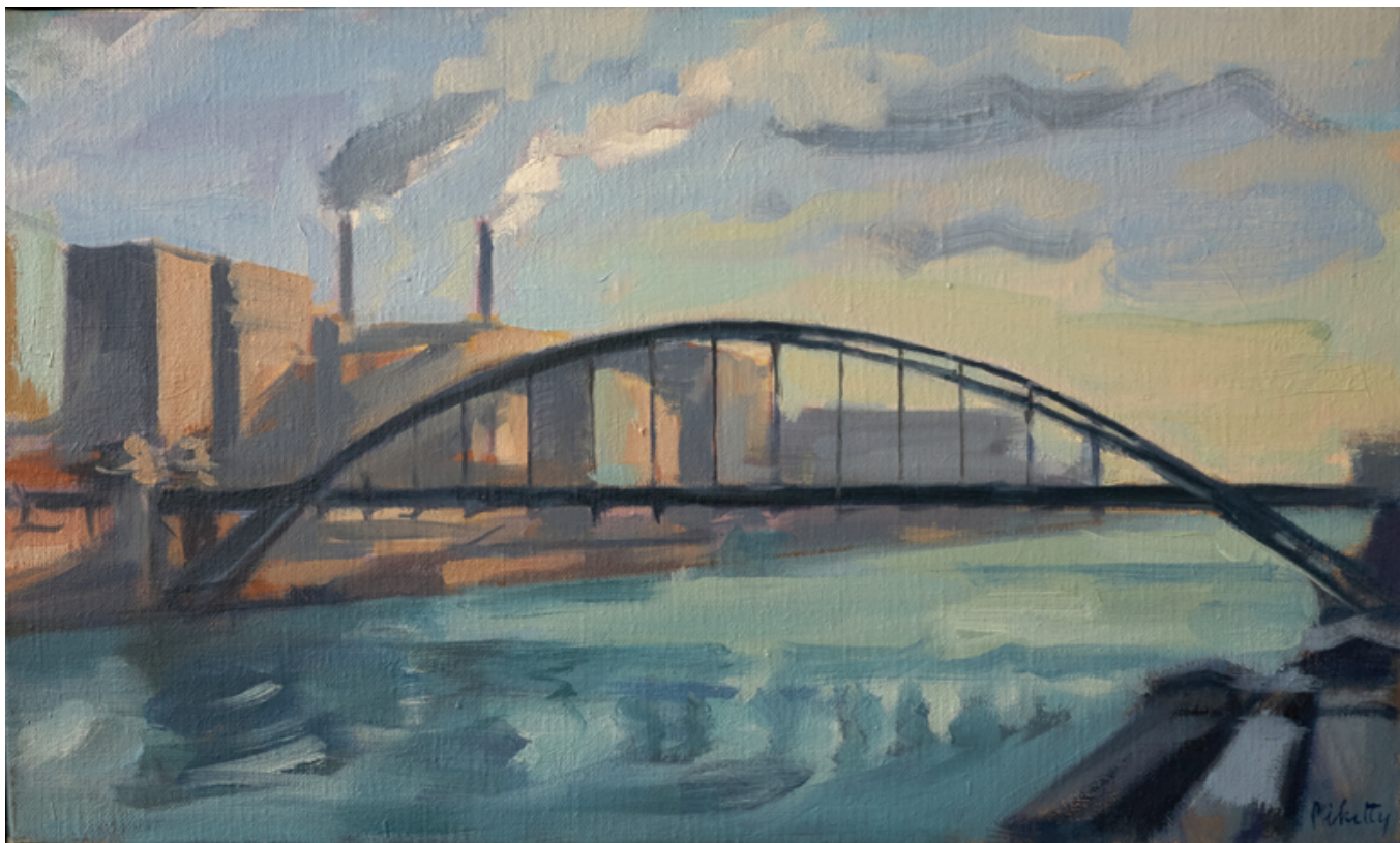
Le viaduc d'Austerlitz Huile sur toile 27 x 46 cm