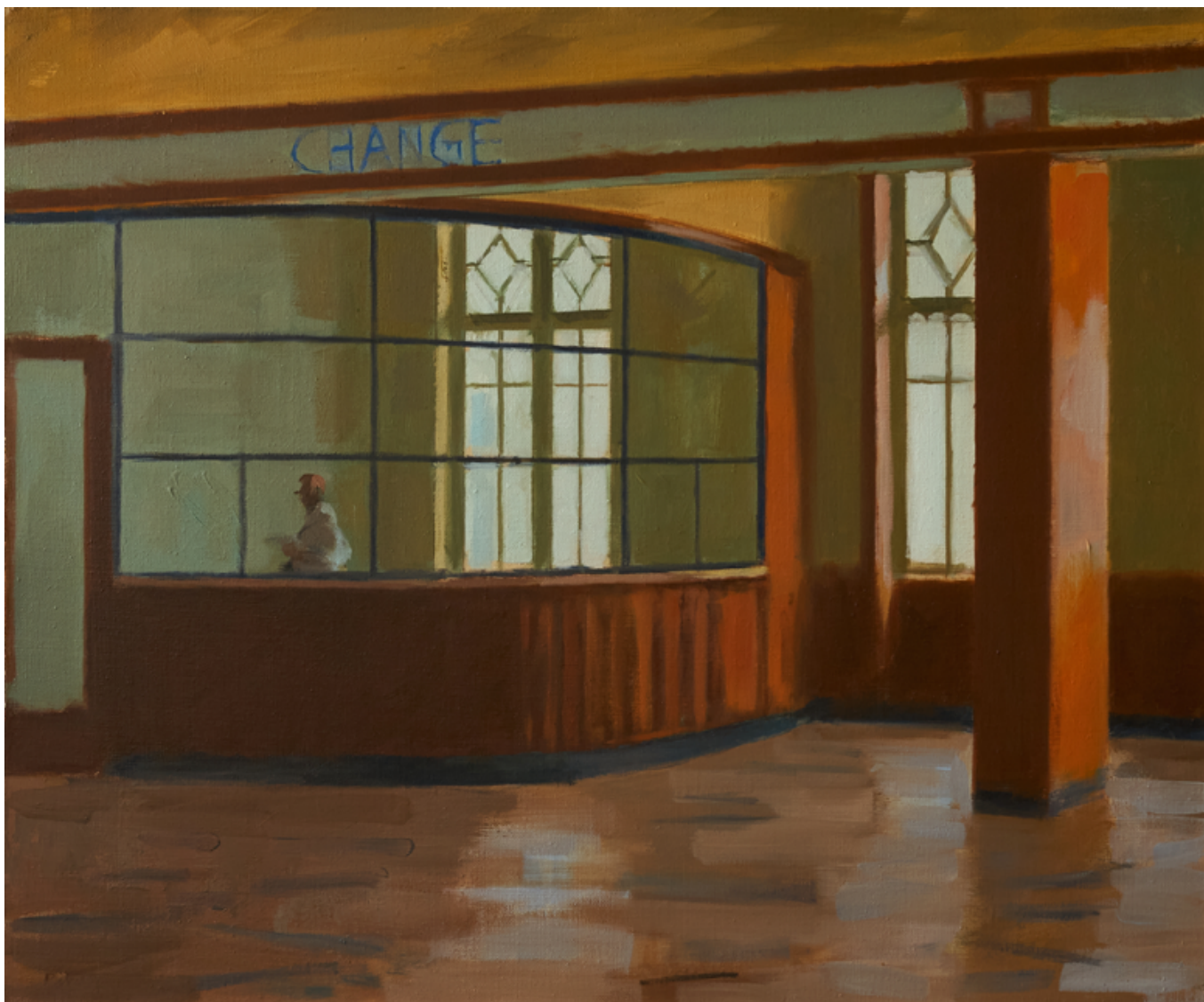
Change - Gare maritime de Cherbourg