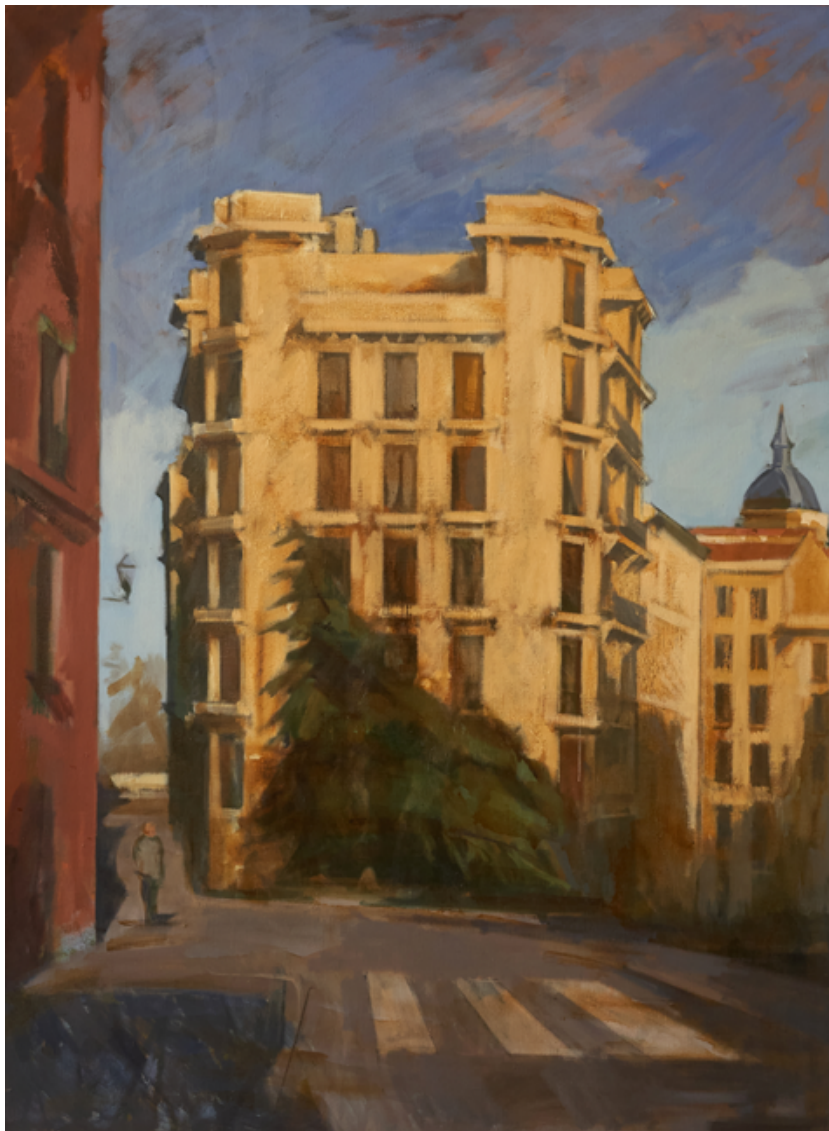
Madrid Huile sur toile 130 x 97 cm