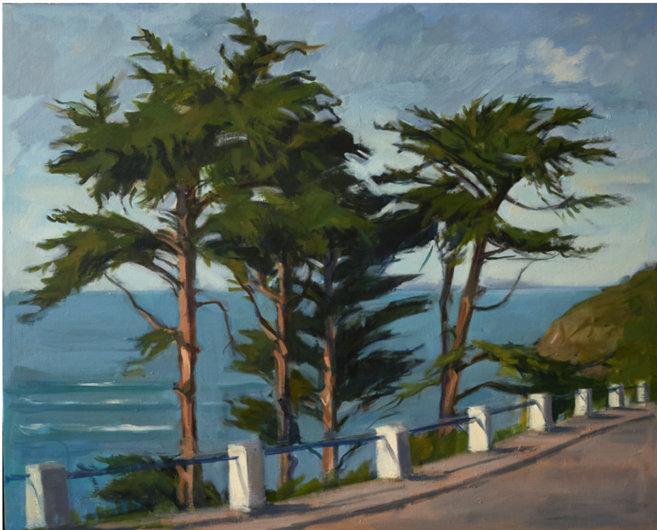
La corniche Huile sur toile 73 x 92 cm