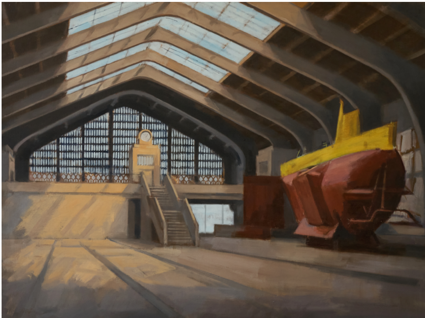
Archimède - Gare maritime de Cherbourg