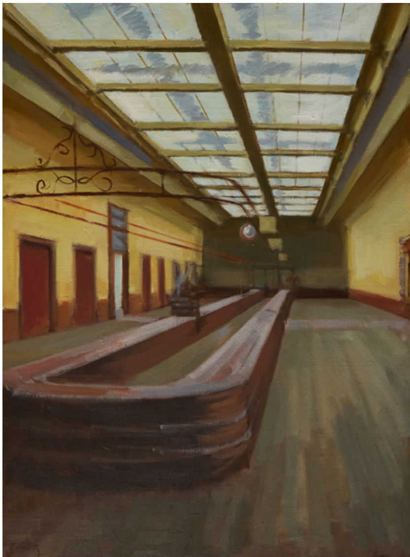
Embarquement - Gare maritime de Cherbourg