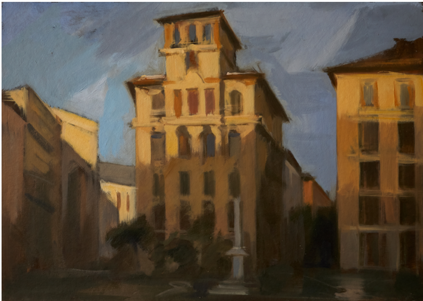
Madrid Huile sur carton 29,5 x 42 cm