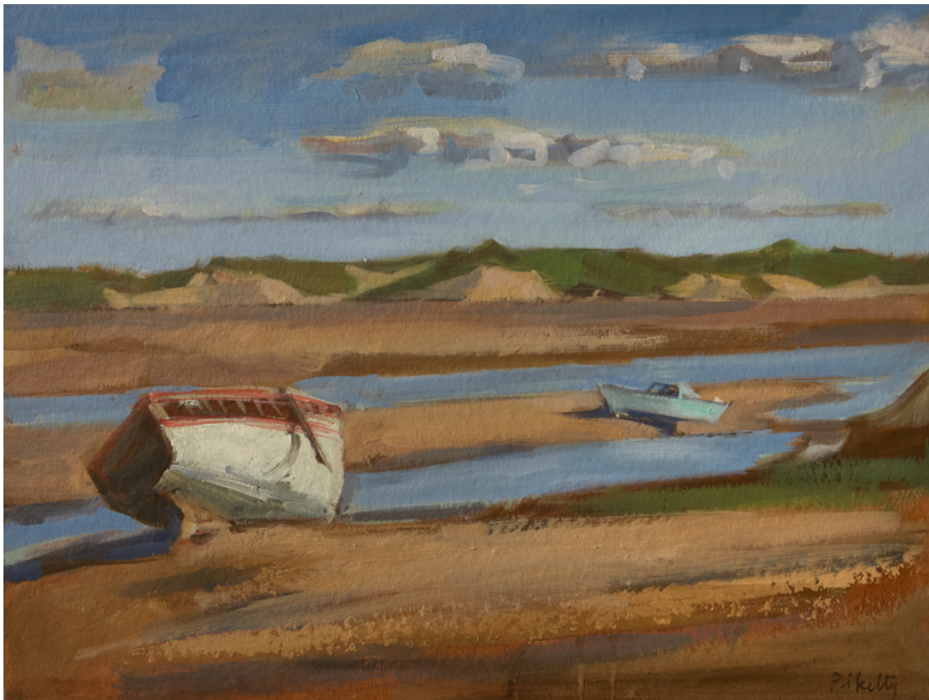
Bateaux échoués Huile sur bois 30 x 40 cm