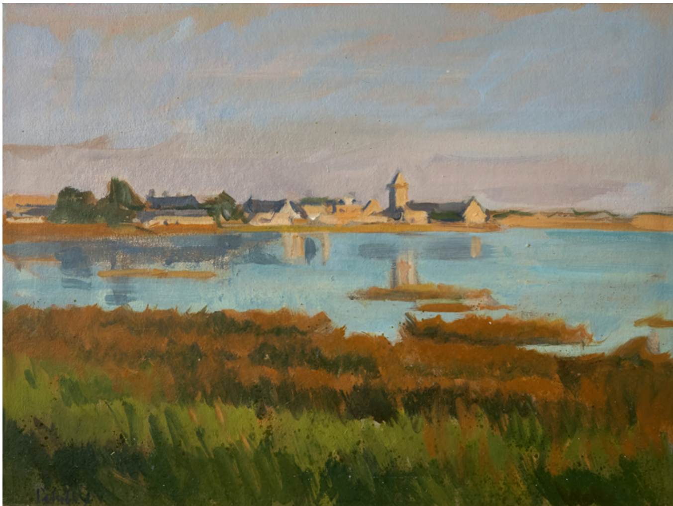
Marée haute - Portbail Huile sur bois 30 x 40 cm